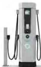
Universal Quick Charger

Stations-service, aires de repos, axes routiers majeurs